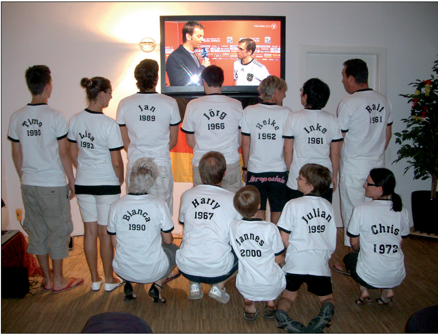
Die „Kuhn-Mannschaft“ bei der Aufstellung.

Mit viel Emotionen und grosser Begeisterung fieberten wir mit unseren Fussballjungs durch die Fussball-WM 2010. Dabei wurde unsere Werkstatt kurzerhand zu einer „Public-Viewing-Arena“ umfunktioniert.