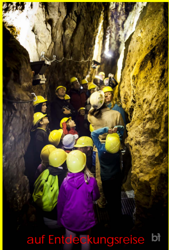
auf Entdeckungsreise bt

Im Laufe des 16. Jahrhunderts ging der Ertrag des Bergbaus allmählich zurück.