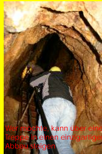
Wer möchte, kann über eine Treppe in einen einzigartigen Abbau steigen

1970 eröffnete die Gemeinde Münstertal das erste Besuchsbergwerk im Schwarzwald.