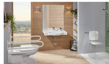
vielleicht so? Schon an Später gedacht!

Oder lieber doch ganz anders?! Fragen Sie uns, wir helfen gerne Ihr neues Traumbad umzusetzen. Rufen Sie uns an! Wir sind Mobil, nicht nur am Telefon: