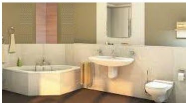
Badezimmer mit viel Platz,